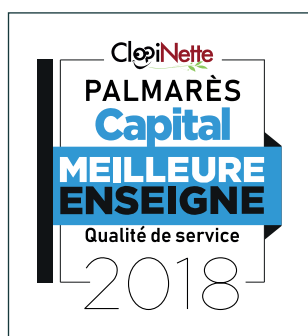
Meilleure Enseigne en qualité de service 2018