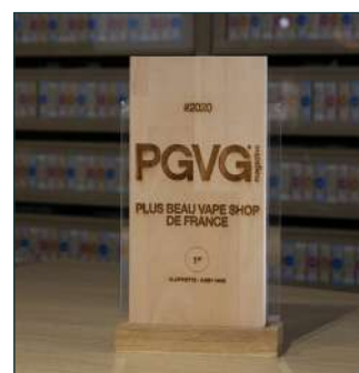
1 er plus beau Vape Shop de France selon le PGVG magazine 2019 Clopinette Caen Hamon