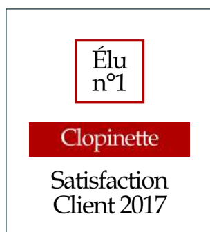
Satisfaction client 2017